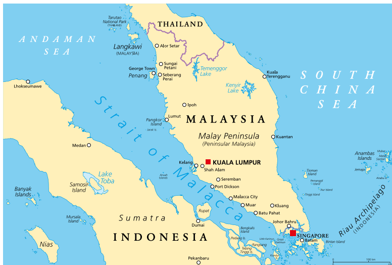
תרשים 1: מצר מלאקה - נתיב תחבורה חיוני לסחר של סין

באזור האינדו-פסיפי הצהירה סין על תביעות טריטוריאליות עבור למעלה מ-90 אחוזים מים סין הדרומי, בניגוד מוחלט לאמנת האו"ם לחוק הים (UNCLOS). כאשר סין טוענת לשימור "אחדות טריטוריאלי" ו"ריבונות לאומית" בין "טריטוריות שלא ניתנות להעברה לאחרים" 11 , היא מעידה על שאיפותיה בים סין הדרומי המונעות על ידי מספר אינטרסים. ראשית, ים סין הדרומי משמש נתיב תחבורה מרכזי בין האוקיינוס השקט לבין האוקיינוס ההודי, בו עובר שליש מהסחר הימי העולמי של סין. כמו כן, ים סין הדרומי מהווה קו תעבורה קריטי לייבוא נפט מהמפרץ הפרסי לסין דרך מצר מלאקה (תרשים 1) 12 .