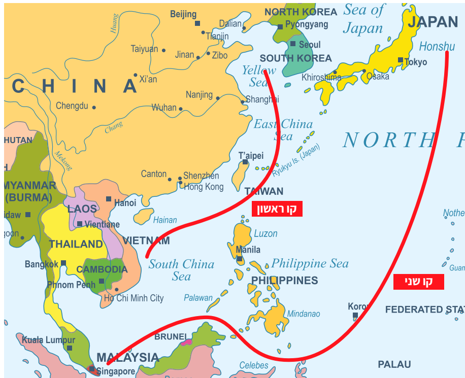
תרשים 2: שרשרת האיים הראשונה ושרשרת האיים השנייה של סין

כדי להשיג את היכולות המבצעיות הדורשות חופש פעולה בים באזורי שרשרת האיים הראשונה ושרשרת האיים השנייה, החליפה סין את אסטרטגיית ההגנה האווירית המסורתית שלה, אשר הייתה בעיקר הגנתית, בתפיסה רחבה יותר, אשר כוללת מרכיבי הגנה התקפיים 55 .